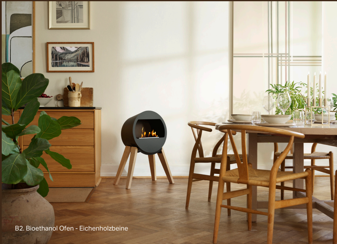
B2. Bioethanol Ofen - Eichenholzbeine