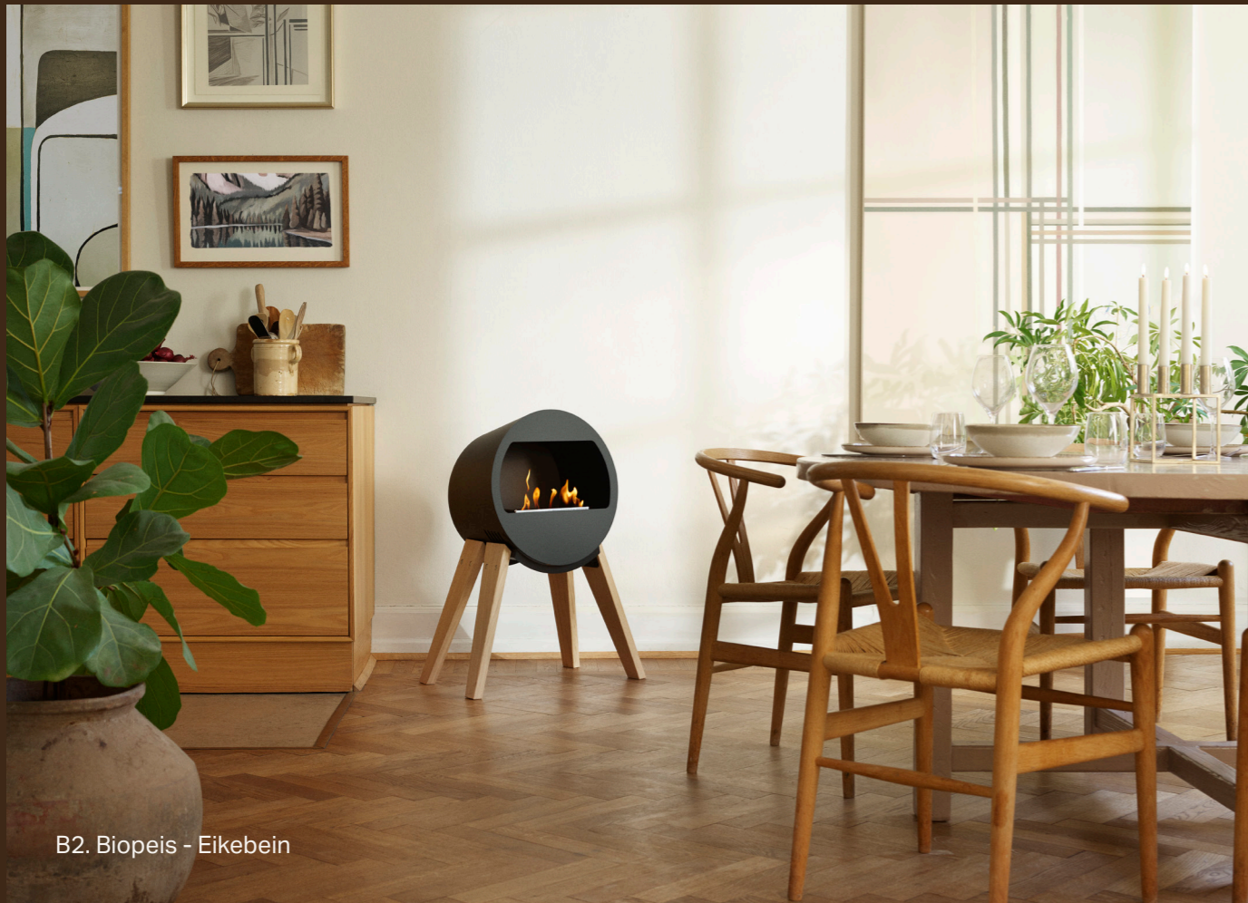
B2. Biopeis - Eikebein