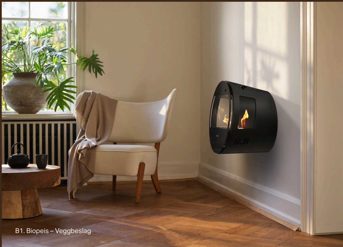
B1. Biopeis – Veggbeslag