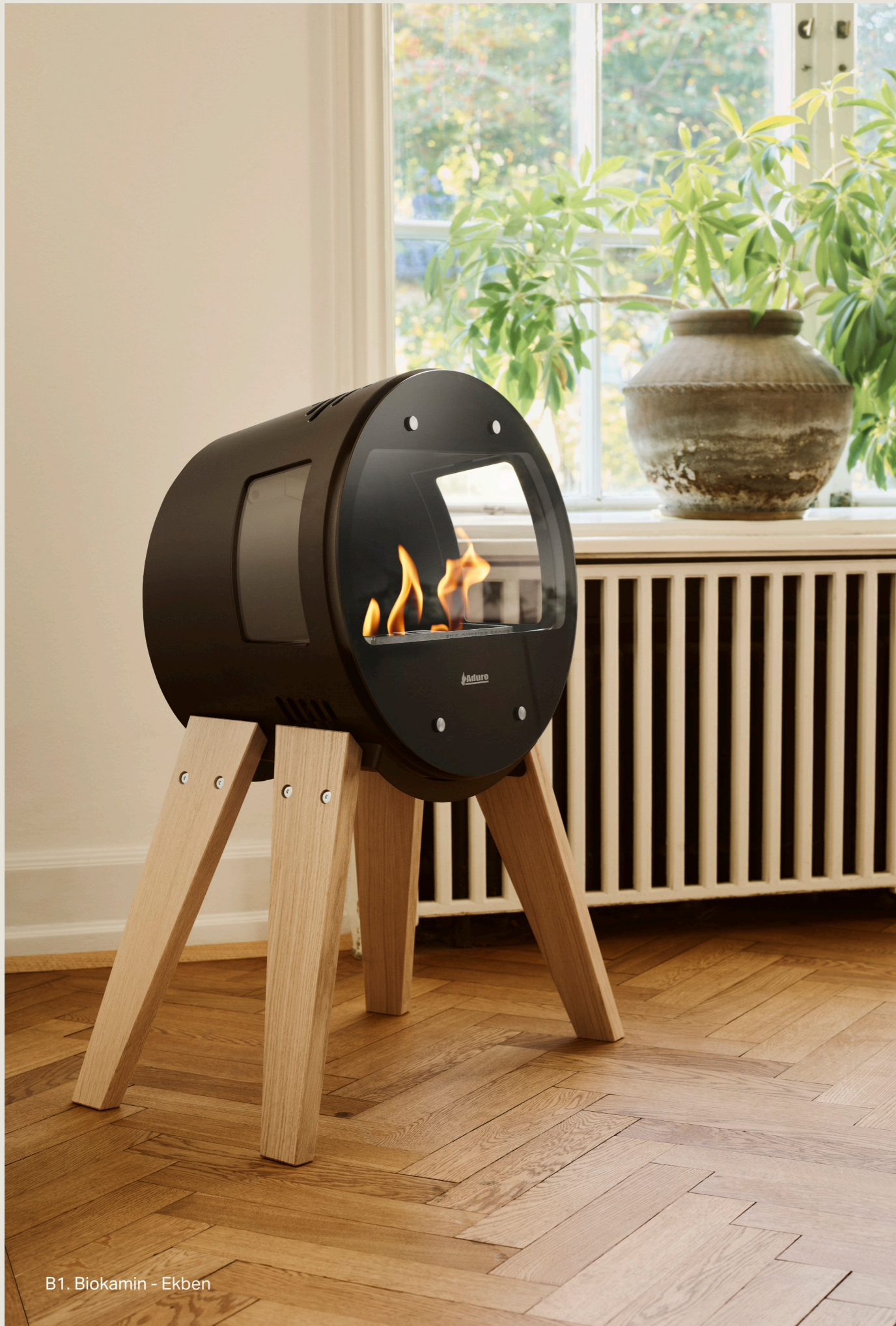
B1. Biokamin - Ekben