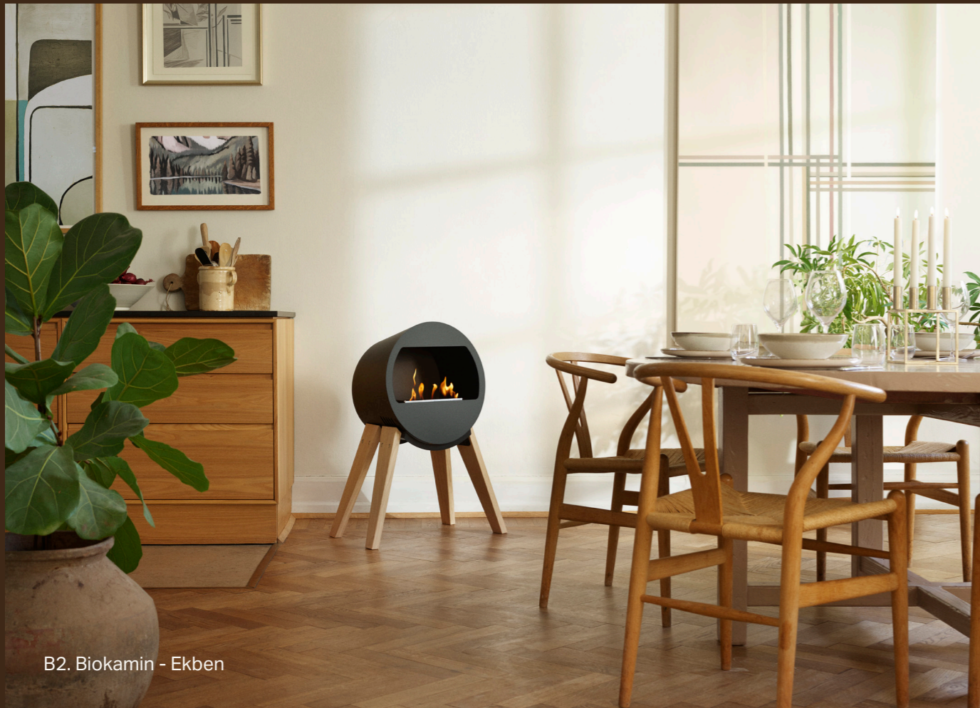
B2. Biokamin - Ekben